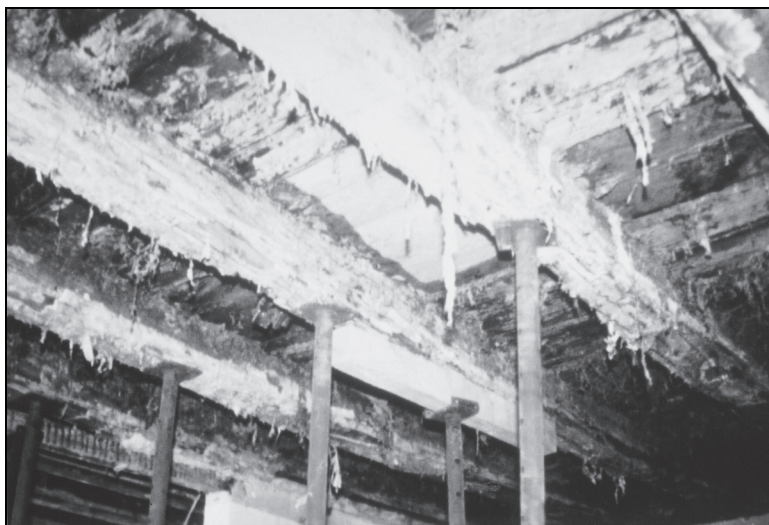
Abbildung 1: Vom Echten Hausschwamm befallene Holzbalkendecke |11

Typische Beispiele für Schadensfälle sind z.B. auf Bohlen einer bestehenden Holzbalkendecke aufgebraute Calciumsulfatfließestriche mit einer thermisch verschweißten Schrenzlage. Den unterseitigen Abschluss der Holzbalken bildet z.B. eine Gipskartondecke. Nach wenigen Monaten der Nutzung wird beim Öffnen der Konstruktion im gesamten Zwischenraum im Bereich der Holzbalken Hausschwammbefall oder weiteres mikrobiologisches Wachstum festgestellt. Die Konstruktionen können oft nicht saniert werden, weshalb komplett neue Tragkonstruktionen einzuziehen sind. Was muss der Planer solcher Bauwerke beachten?